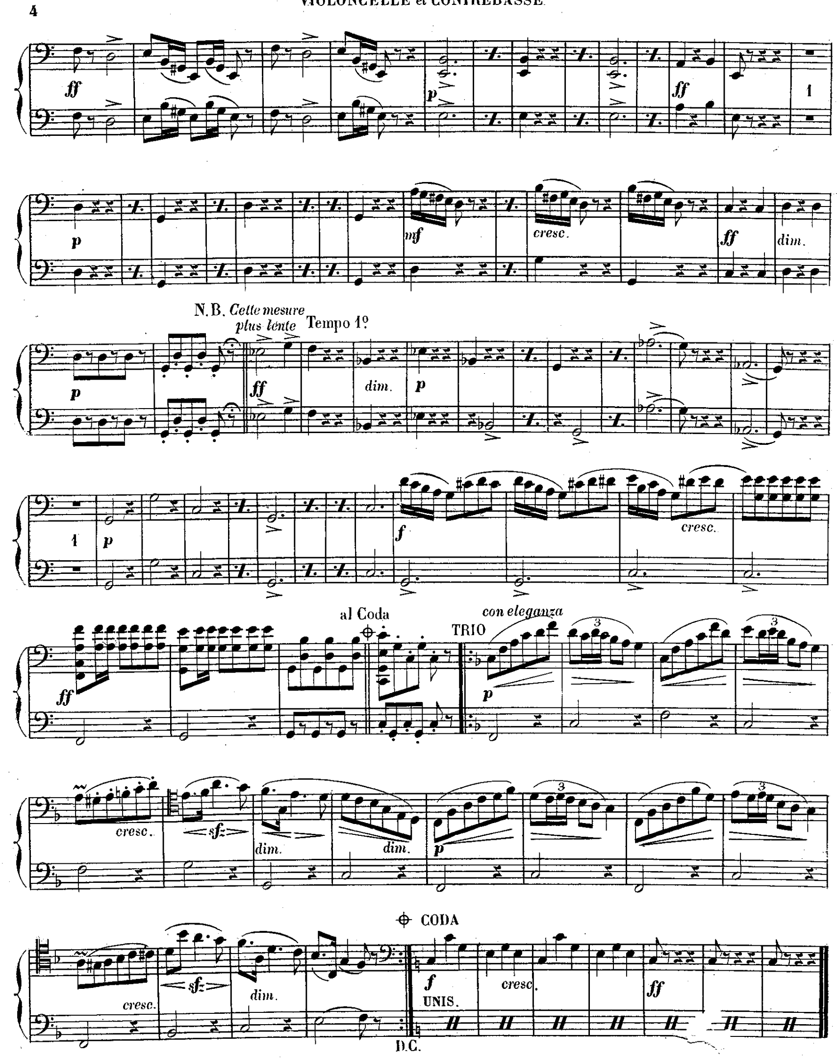
E.F. et C.1216.